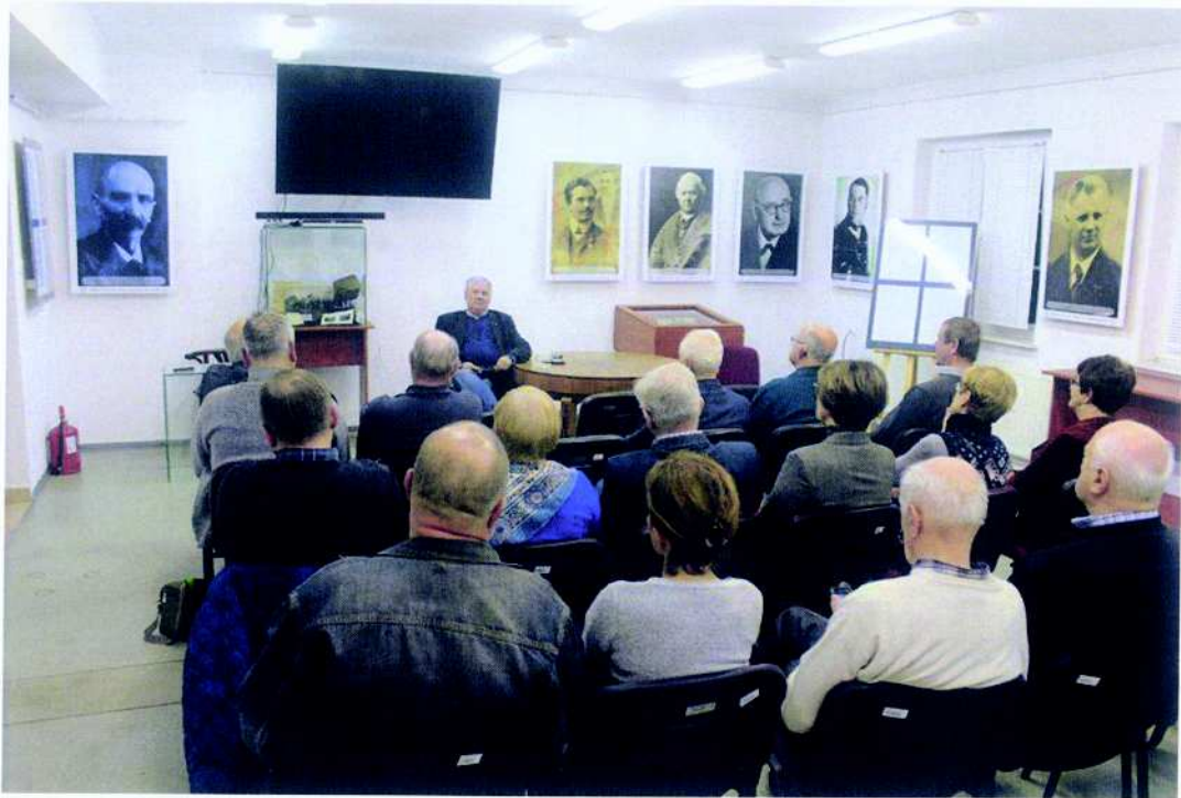
Mikołowskie Towarzystwo Historyczne projekt pn. „Spotkania ze Śląskiem”