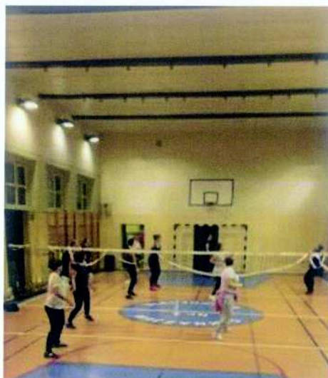
Stowarzyszenie Mieszkańców Dzielnicy Nowy Świat Wymyślanka projekt pn. „Ćwiczymy z Wymyślanką”