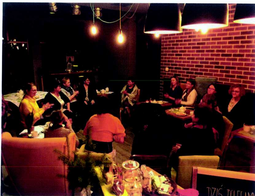
Fundacja Herbateka projekt pn. "Mikołowska Wszechnica Kreatywności - warsztaty twórcze"