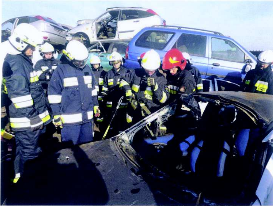
Związek Ochotniczych Straży Pożarnych Rzeczypospolitej Polskiej Zarząd Oddziału Miejskiego w Mikołowie projekt pn. „Ratownictwo i ochrona ludności”