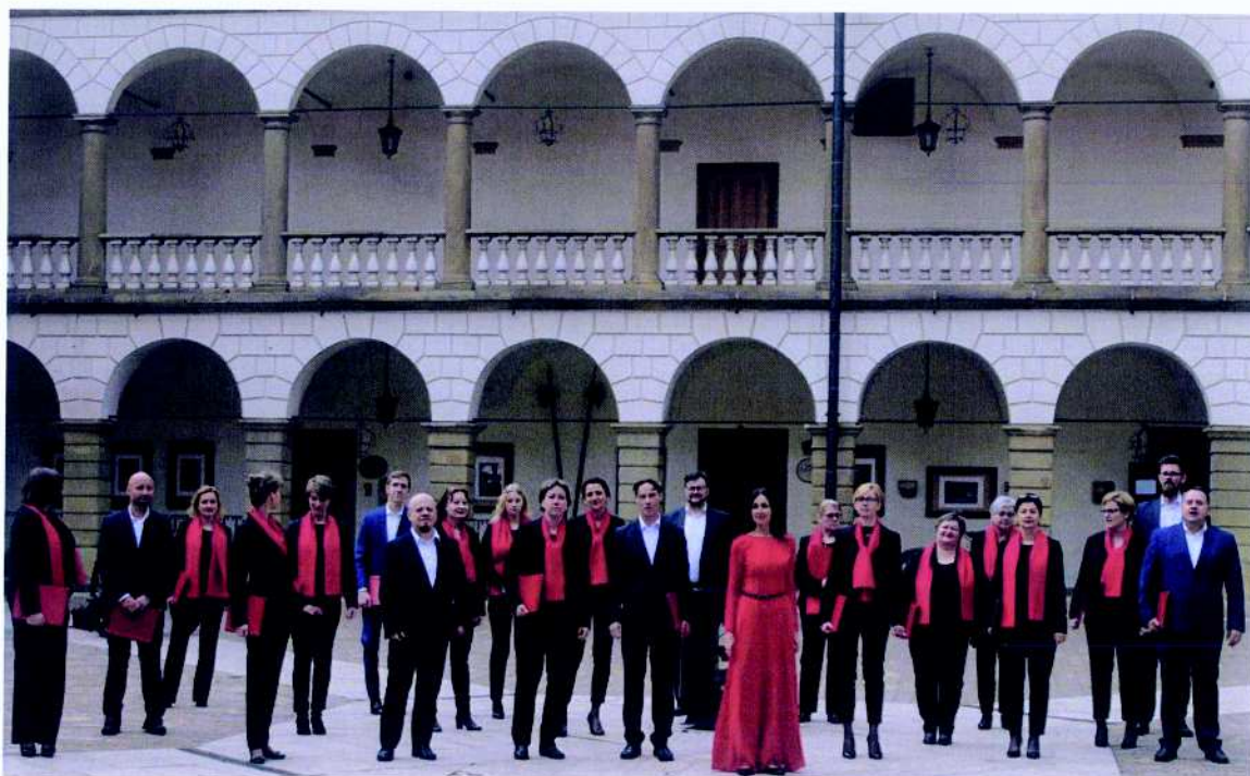
Mokierskie Stowarzyszenie Muzyczne projekt pn. „Działalność muzyczna Mokierskiego Chóru Kameralnego”