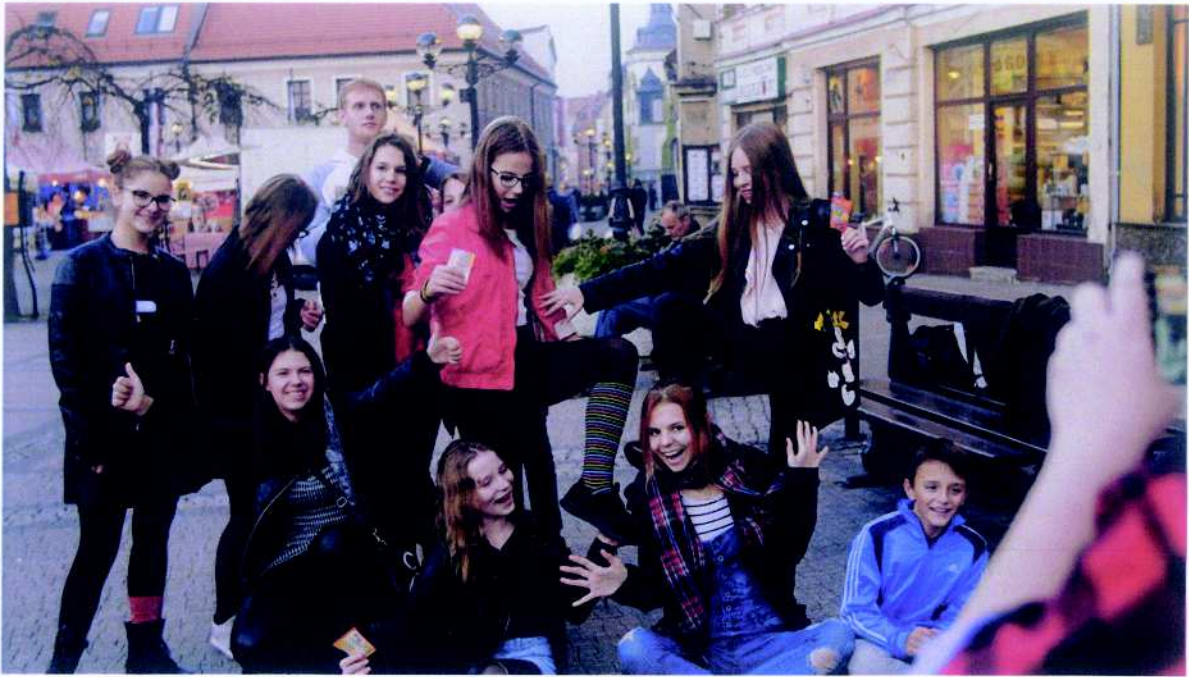
Fundacja Pomocy Dzieciom ULICA projekt pn. „Profilaktyka uniwersalna - Ambasadorzy Niemożliwego”