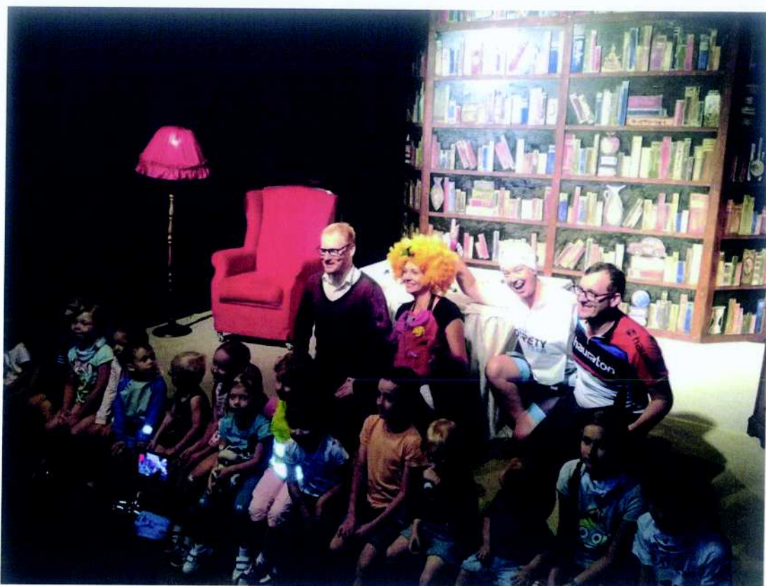
O'RETY - Fundacja Promująca Aktywność projekt pn. „O'Rety! Bajkiem na Bajki!”