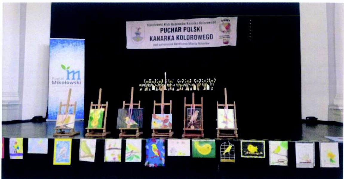
Stowarzyszenie Mikołowski Klub Hodowców Kanarka Kolorowego projekt pn. „Puchar Polski kanarka Kolorowego”