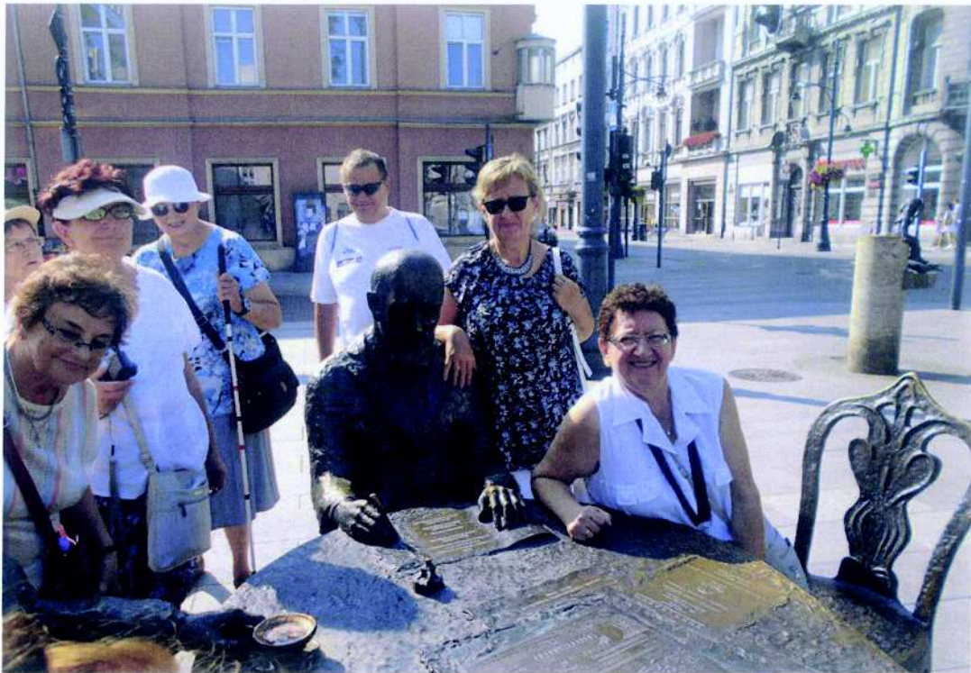
Polski Związek Niewidomych Okręg Śląski Koło w Mikołowie projekt pn. „Odkryjmy Łódź”