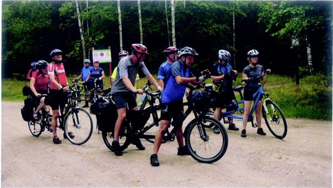
Fundacja Brajlówka projekt pn. „XVII Integracyjny Rajd Rowerowy "DUET 2019 - Ziemia Drawska”