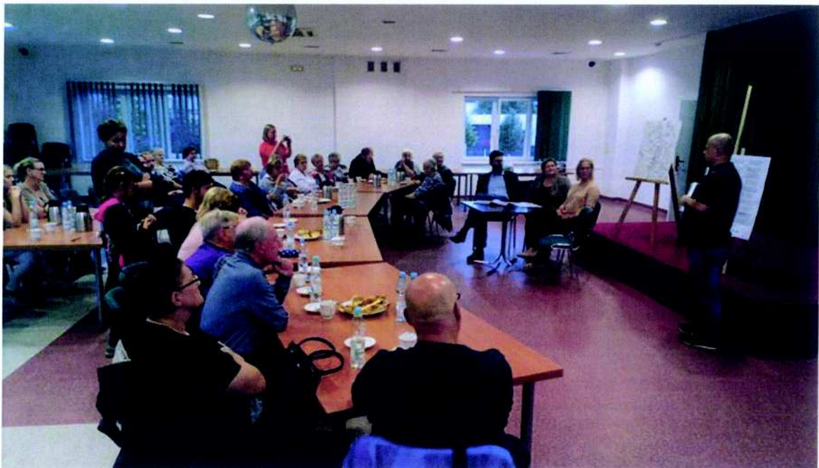
Fundacja Dom Modernisty projekt pn. „Szlak Mokierskich Legend”