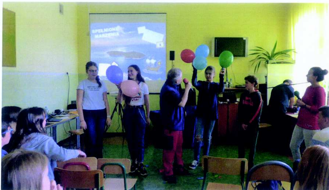
YAQ PROJEKT PRACOWNIA ROZWOJU SPOŁECZNEGO - Realizacja programu profilaktyki zintegrowanej dla młodzieży „Archipelag Skarbów”