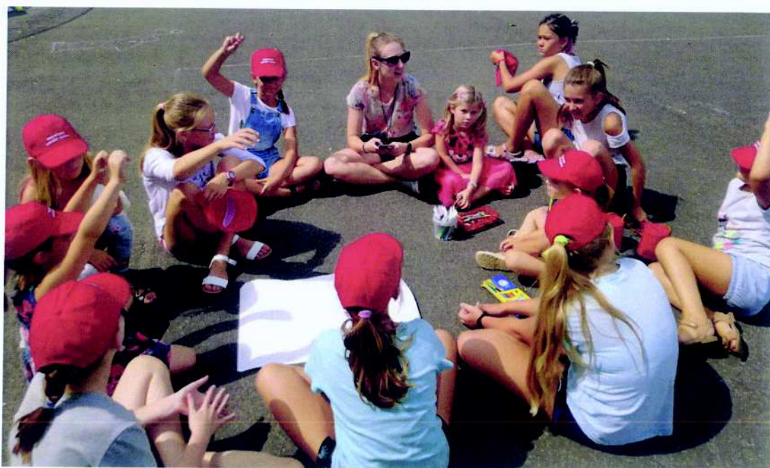
Związek Harcerstwa Polskiego Chorągiew Śląska Komenda Hufca Ziemi Mikołowskiej projekt pn. Organizacja półkolonii "Wakacyjny zawrót głowy"