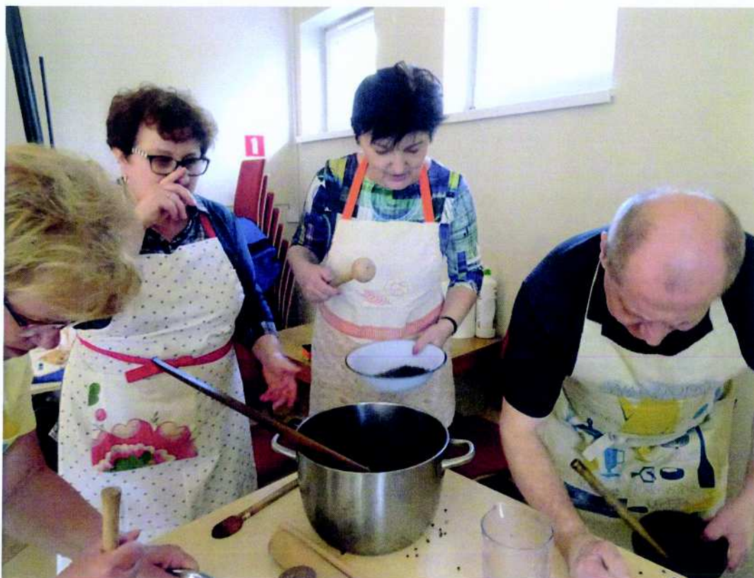
Stowarzyszenie BATUT projekt pn. „Tradycjo ślonsko na bez tydzień i łód święta”