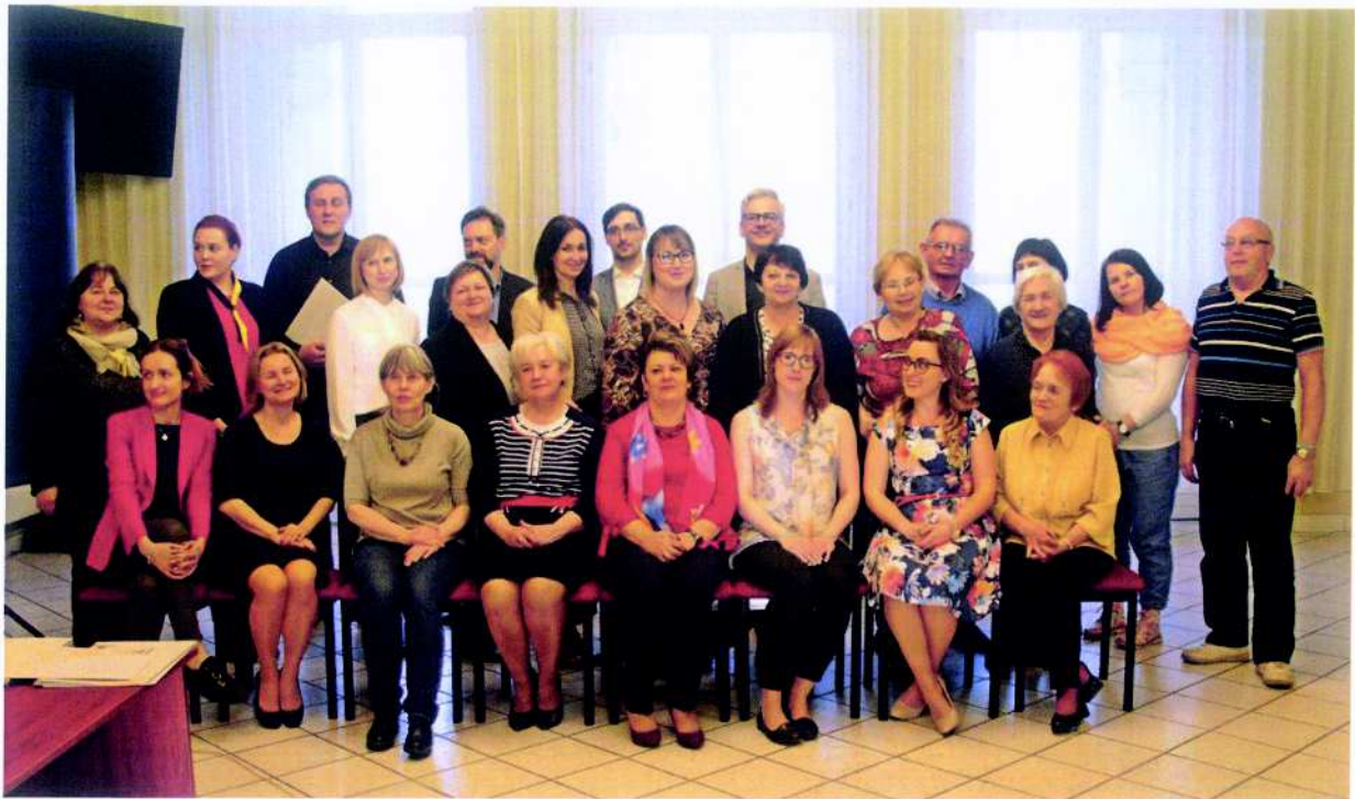
Spotkanie przedstawicieli organizacji pozarządowych, członków Komisji Konkursowych, pracowników Urzędu Miasta i jednostek organizacyjnych