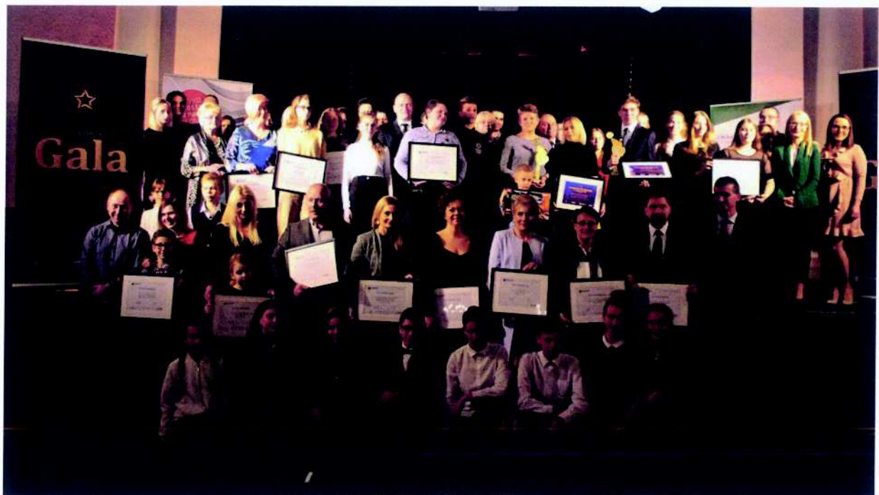
Centrum Społecznego Rozwoju projekt pn. „Mikołowska Gala Wolontariatu 2019”