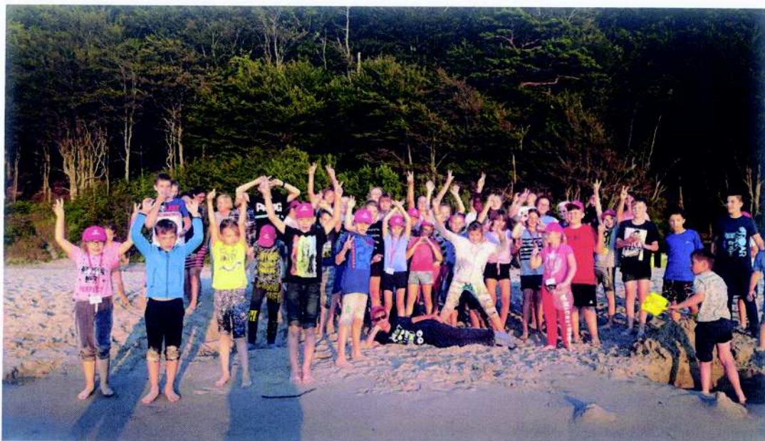
Stowarzyszenie Siloe projekt pn. „Morska przygoda”