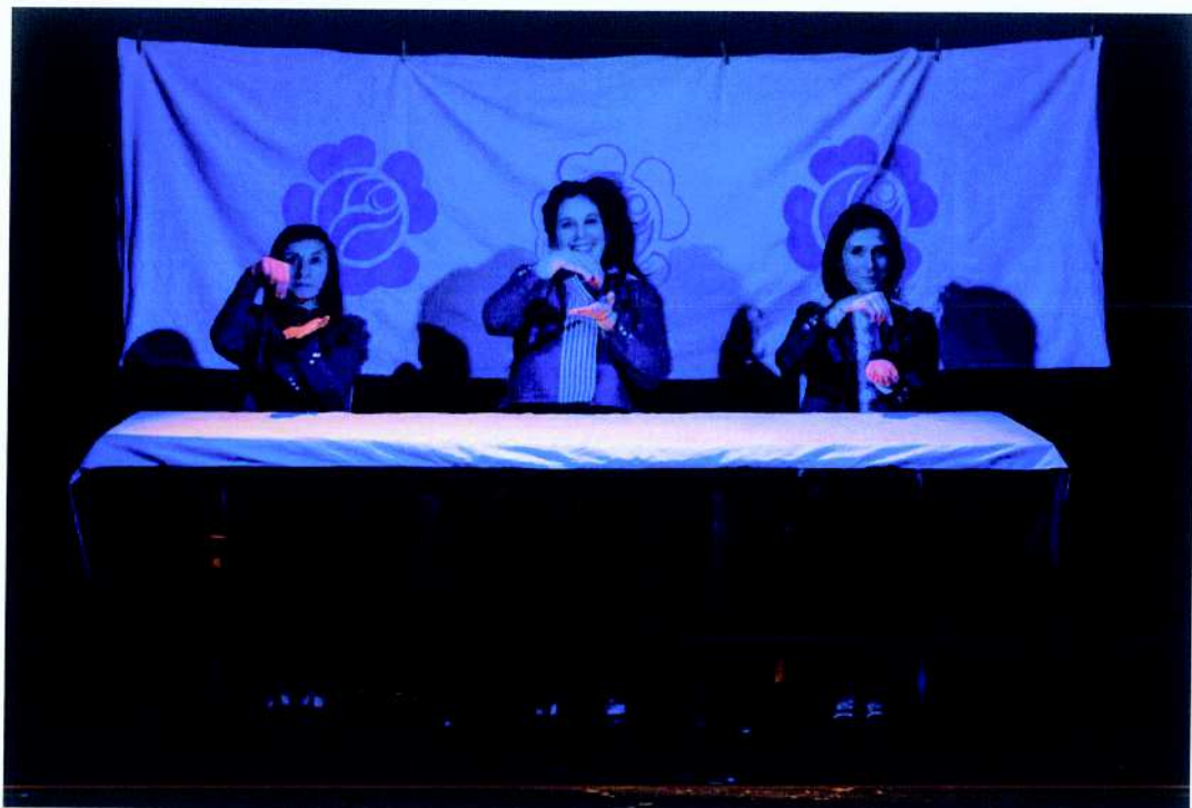
Fundacja Szafa Gra projekt pn. „Objazdowy Dom Kultury”