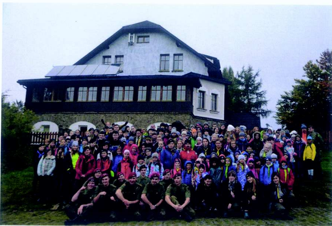
Związek Harcerstwa Polskiego Chorągiew Śląska Komenda Hufca Ziemi Mikołowskiej projekt pn. „Jesienne Spotkania na szlaku”