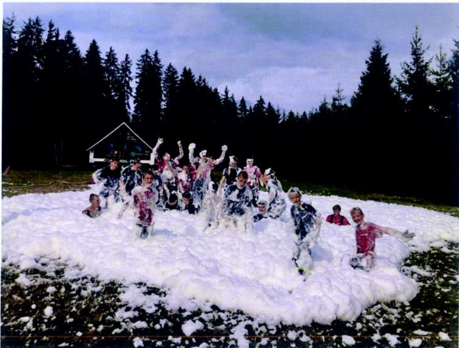
Związek Ochotniczych Straży Pożarnych Rzeczypospolitej Polskiej Zarząd Oddziału Miejskiego w Mikołowie i Obóz Młodzieżowych Drużyn Pożarniczych