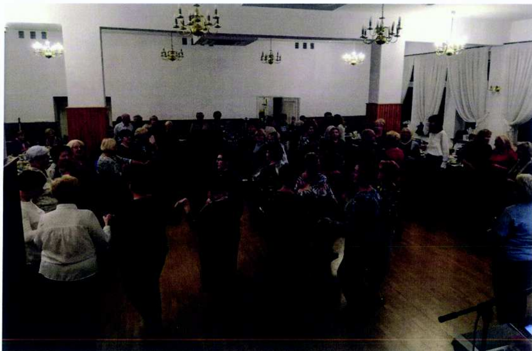
Fundacja Zakątek Pokoleń projekt pn. „Atrakcyjny senior - zajęcia rekreacyjne dla mikołowskich seniorów”