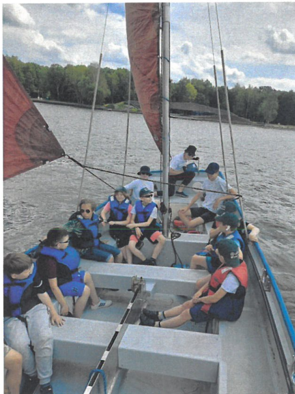
Związek Harcerstwa Polskiego Chorągiew Śląska Komenda Hufca Ziemi Mikołowskiej – realizacja zdania publicznego pn.: „Poszukiwacze przygód – organizacja półkolonii”