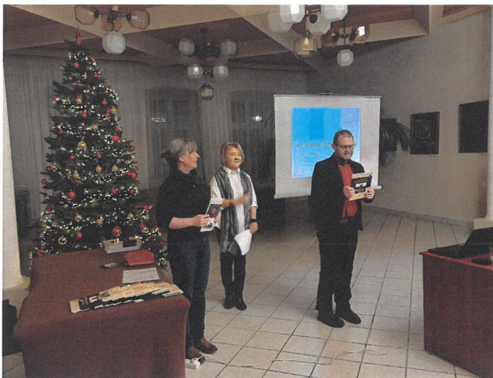
Mikołowskie Towarzystwo Historyczne – realizacja zadania publicznego pn.: „Mikołów – niezapomniana historia”