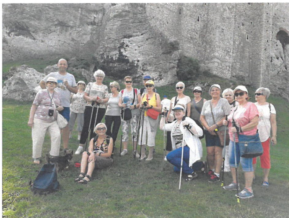
Fundacja Zakątek Pokoleń – realizacji zadania publicznego pn.: „SPA Senior – zajęcia rekreacyjne dla mikołowskich seniorów”