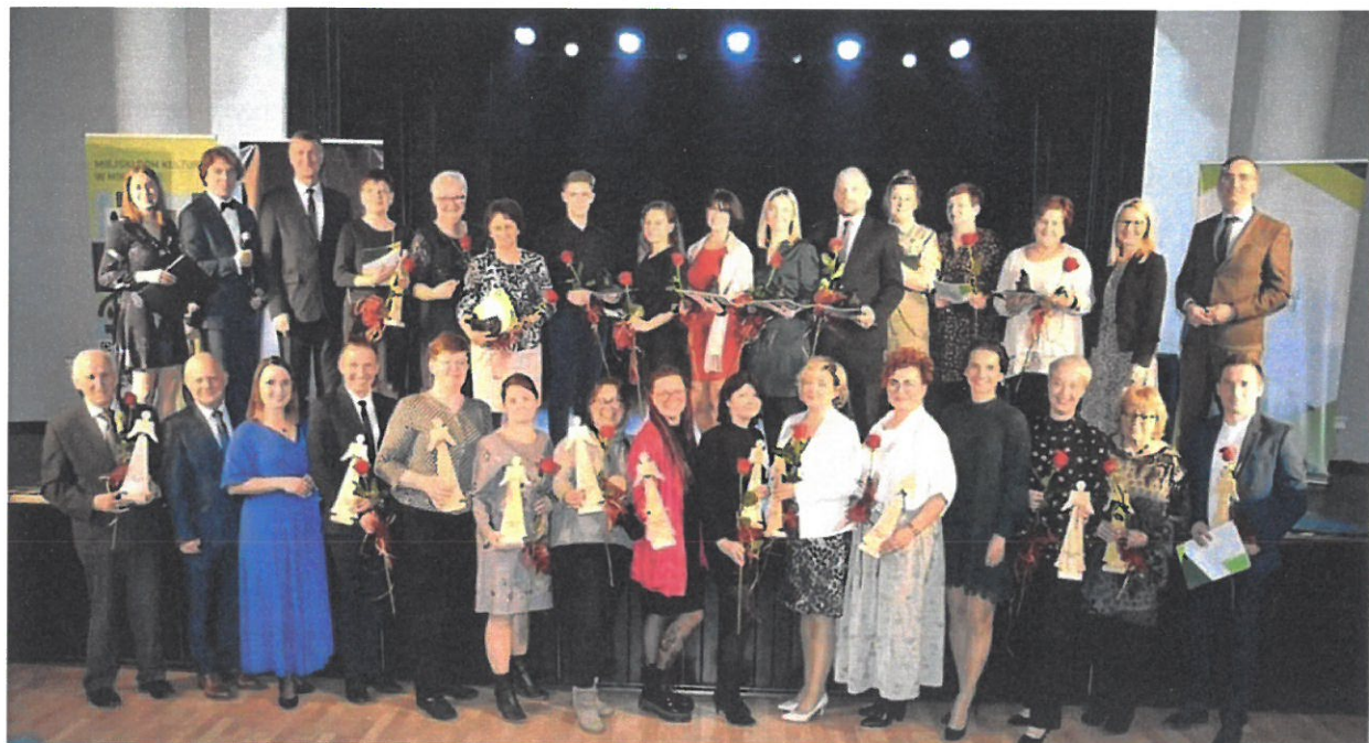
Gala Wolontariusza 2022