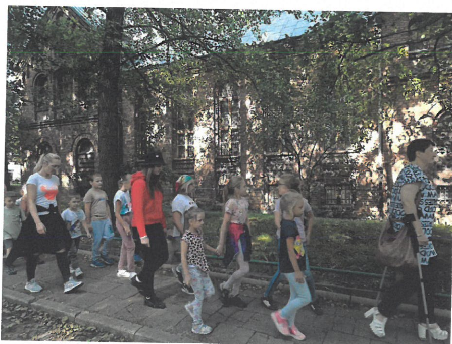
Stowarzyszenie Uśmiech - realizacja zadania publicznego pn. „Gibko rajza po śląsku”.