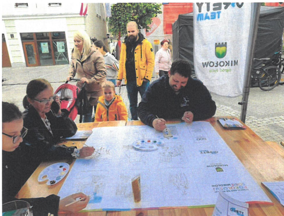
O'Rety Team - realizacja zadania publicznego pn.: „O'Rety! Raz na 800 lat pokoloruj sobie Mikołów”.