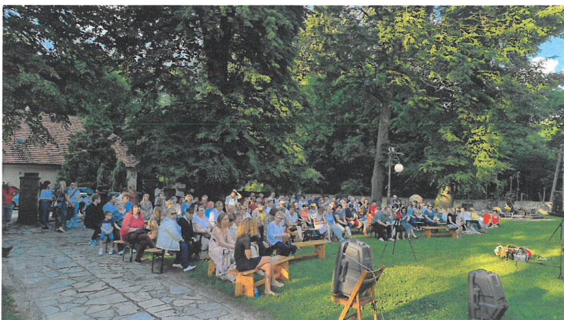
Mokierskie Stowarzyszenie Muzyczne – realizacja zadania publicznego pn.: „Mikołów moja miłość – Mokierski Chór Kameralny 2022”