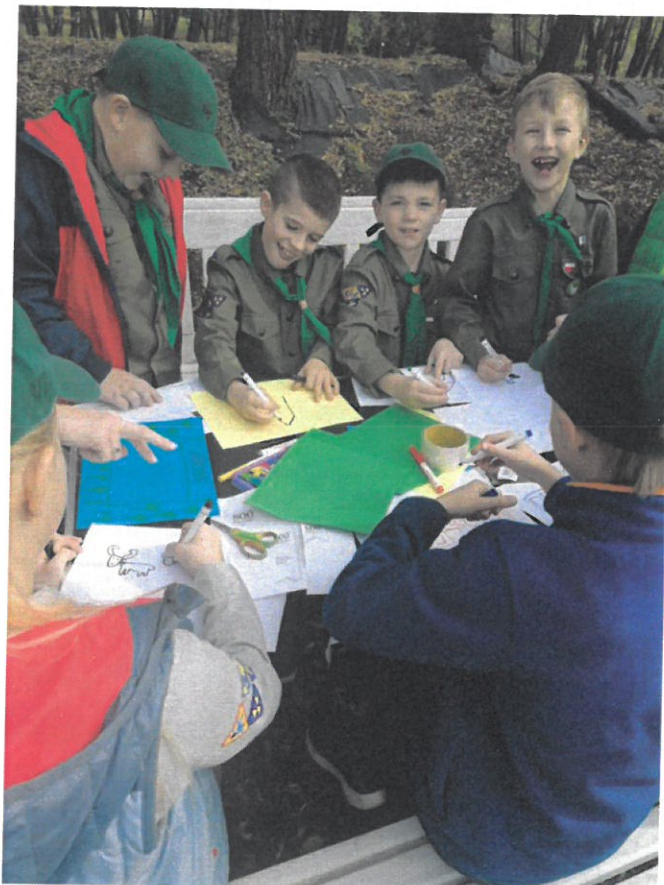
Związek Harcerstwa Polskiego Chorągiew Śląska Komenda Hufca Ziemi Mikołowskiej – realizacja zadania publicznego pn. „1,2,3 Grasz Ty!”.