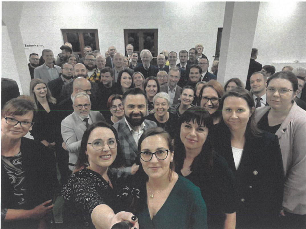
Centrum Aktywności Społecznej - oficjalne otwarcie budynków Rynek 2 i Wojciecha 14