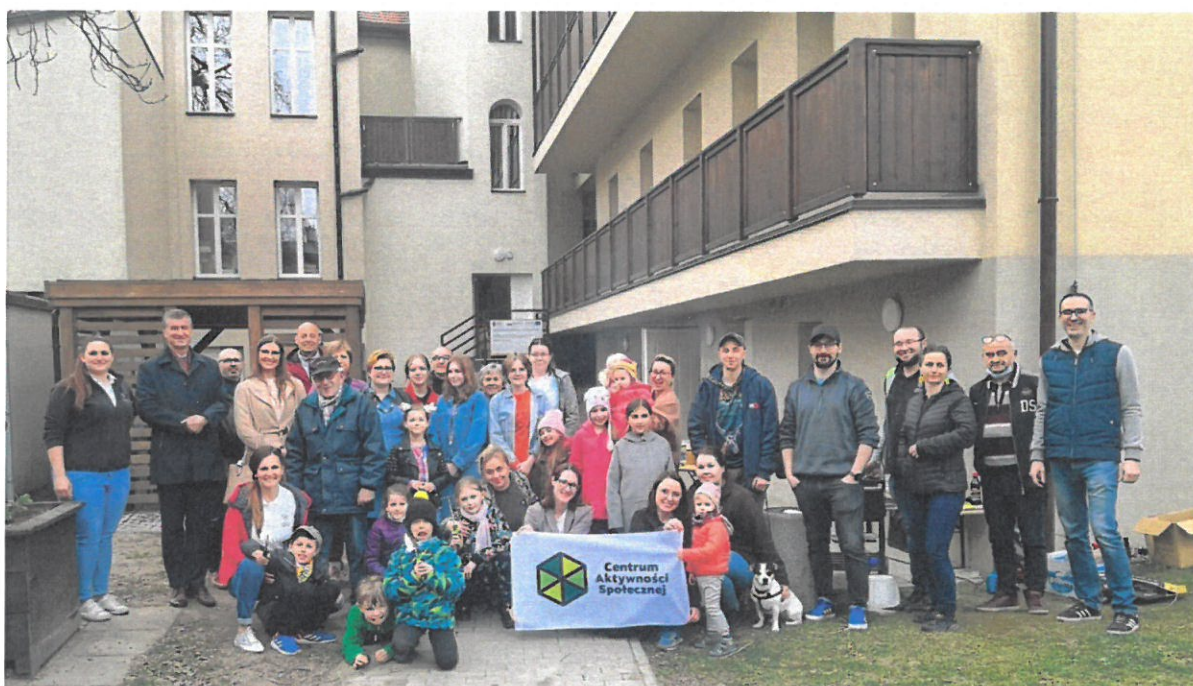
Centrum Aktywności Społecznej – Grill Społeczny