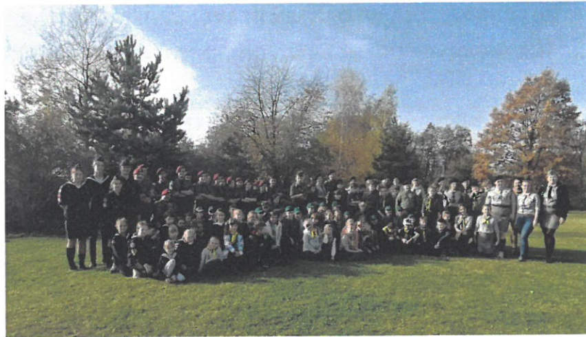
Związek Harcerstwa Polskiego Chorągiew Śląska Komenda Hufca Ziemi Mikołowskiej – realizacja zadania publicznego pn.: „Jesienne spotkania na szlaku”