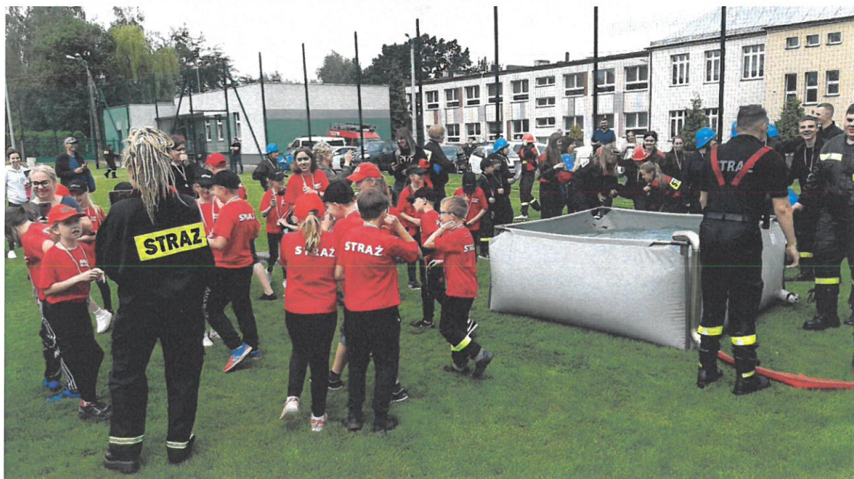
Zawody Ochotniczych Straży Pożarnych