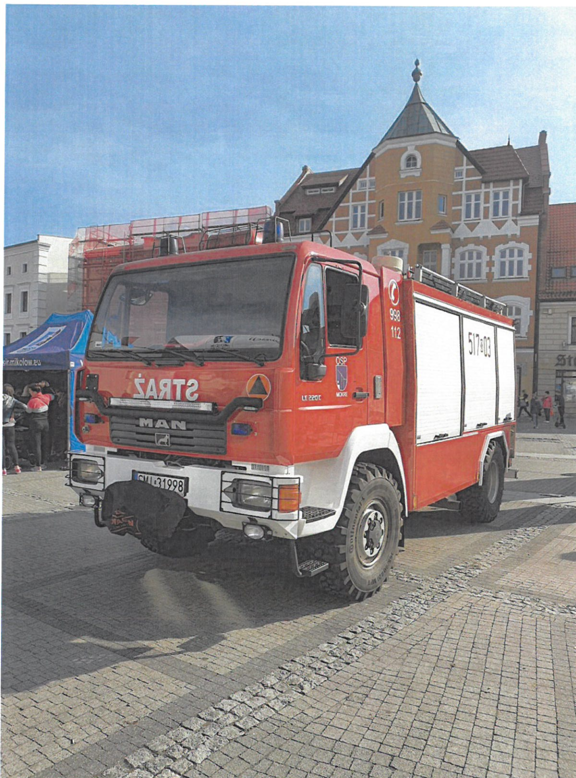
Samochód po zakończonym remoncie.