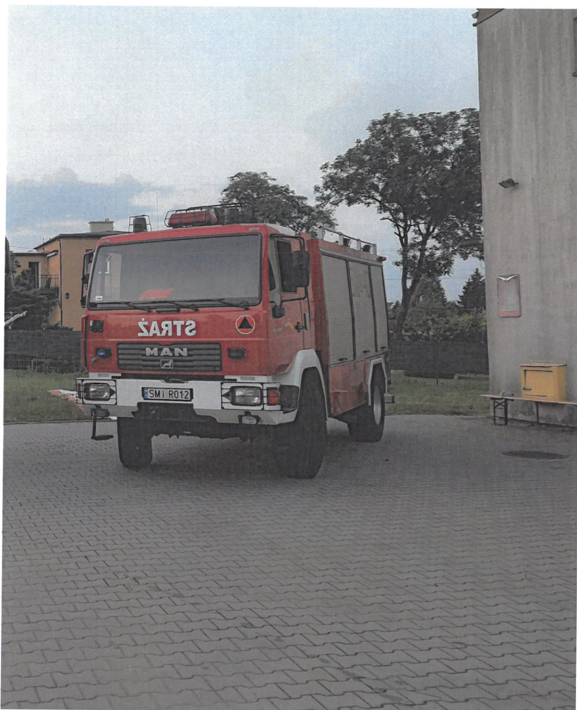
Samochód w dniu przekazania na placu OSP Mokre